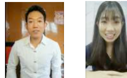
スマートフォンでも確認できる 自己紹介動画