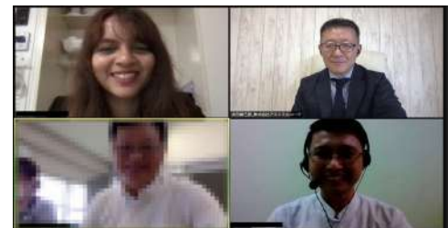
オンライン面接では同時通訳者も同席

※本記載内容の無断での転載・記載を厳禁とします Copyright(c) 2003-2022 Astmilcorp Co., Ltd.. All rights reserved.