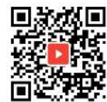
ミャンマー人管理者 インタビュービデオ

※本記載内容の無断での転載・記載を厳禁とします Copyright(c) 2003-2022 Astmilcorp Co., Ltd.. All rights reserved.