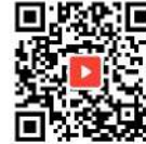
インターンシップ生 自己紹介ビデオ

※本記載内容の無断での転載・記載を厳禁とします Copyright(c) 2003-2022 Astmilcorp Co., Ltd.. All rights reserved.