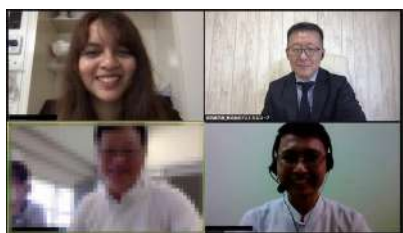
オンライン面接では面接官と同時通訳者が同席します